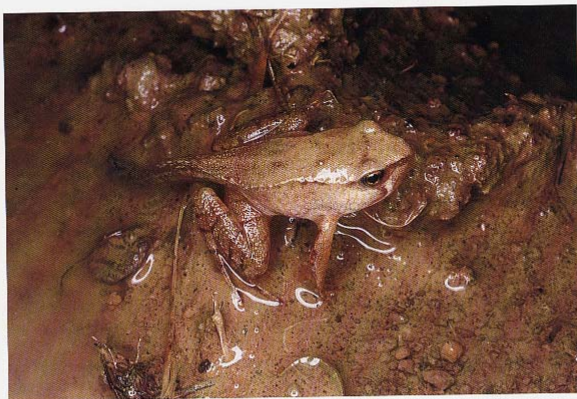
120.VF In Lombardia Rana temporaria (nella foto un neometamorfosato) è tra gli Anfibi più comuni nella fascia montana e pedemontana alpina.

almeno la fine del secolo scorso) delle raccolte d'acqua costruite in Lombardia per uso pastorale o domestico, di conseguenza non è possibile effettuare un confronto con la situazione attuale.